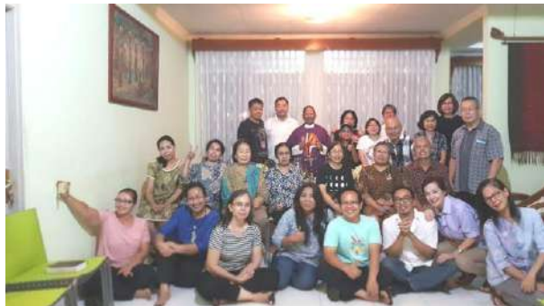
Lingk. St. Monika (III) 12/3/2018

Berikut ini beberapa gambaran suasana kemeriahan kunjungan pastoral ke lingkungan.