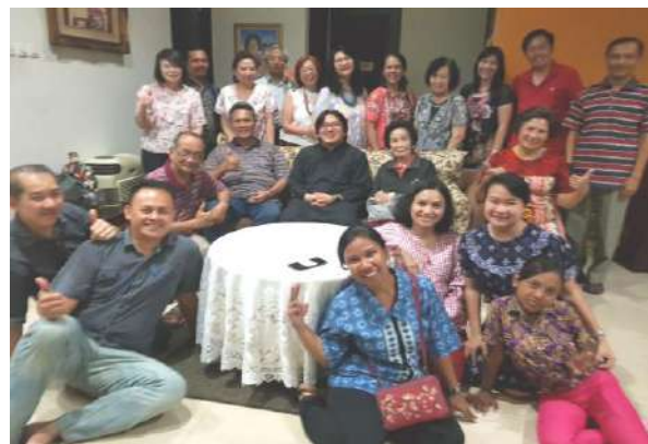
Lingk. St. Thomas Aquinas (III) 8/3/2018