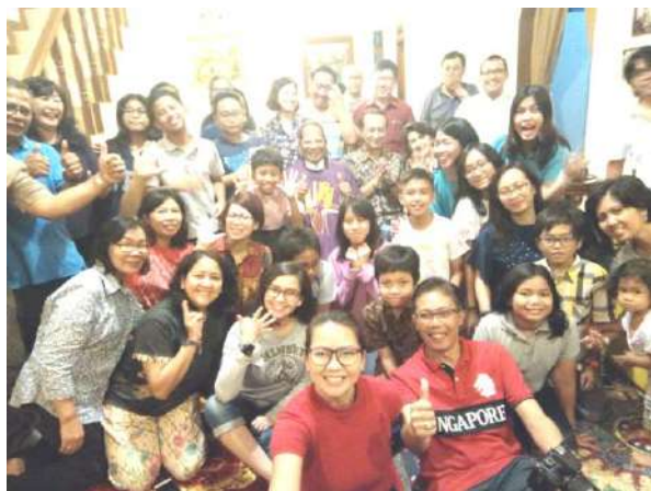
Lingk. Sanmararo (V) 14/3/2018