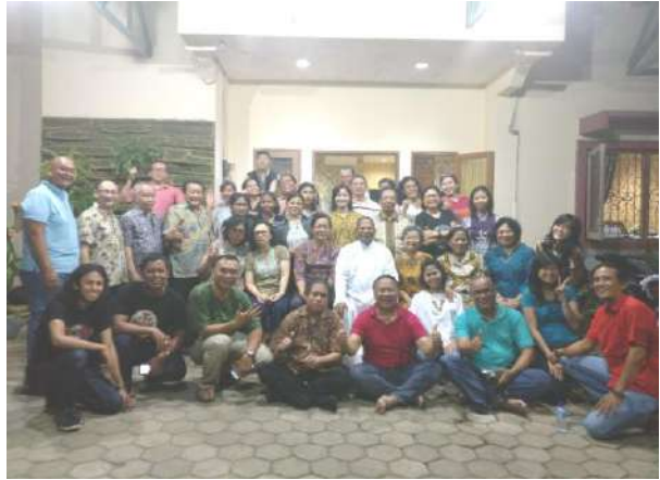
Lingk. Yohanes De Britto (I) 13/3/2018