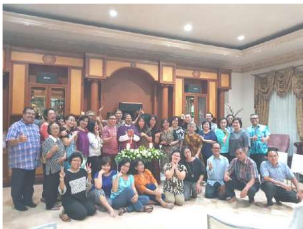
Lingk. St. Regina (II) 15/3/2018