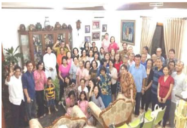
Lingk. St. Theresia (III) 12/3/2018