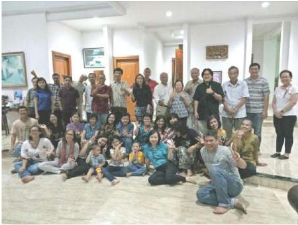
Lingk. St. Thomas Rasul (VI) 13/3/2018